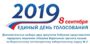
ГРАФИК Территориальной избирательной комиссии Бабынинского района для проведения досрочного голосования на дополнительных выборах двух депутатов Собрания Представителей городского поселения «Поселок Воротыньск» третьего созыва по Воротынскому пятимандатному избирательному округу № 2

Территориальная избирательная комиссия Бабынинского района в период с 28 августа 2019 года по 7 сентября 2019 года ежедневно осуществляют рассмотрение заявлений и проводят досрочное голосование избирателей, которые по уважительной причине (отпуск, командировка, режим трудовой и учебной деятельности, выполнение государственных и общественных обязанностей, состояние здоровья и иные причины – статья Федерального закона № 67 – ФЗ «Об основных гарантиях избирательных прав и права на участие в референдуме граждан Российской Федерации») не смогут принять участие в голосовании на избирательном участке, где они внесены в список избирателей.